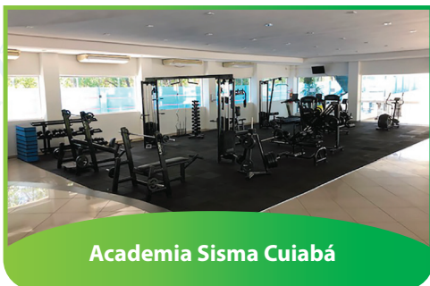
Academia Sisma Cuiabá

Projeto de Revitalização do Prédio (fundos do Salão de Festas em Cuiabá), mudando a Academia de Ginástica para esse novo espaço, aonde hoje funciona provisoriamente a Administração.