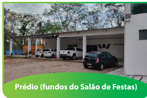
Prédio (fundos do Salão de Festas)

Finalizar a regularização da obra dos novos alojamentos em Cuiabá, paralisadas pelo Ministério Público Estadual em função do descumprimento à Lei nº 11.109/2020 (gestão patrimonial do Estado) e Decreto nº 703/2020 (que regulamenta a Lei nº 11.109/2020 na disponibilização de imóveis públicos), e sem as devidas Licenças junto a Prefeitura.