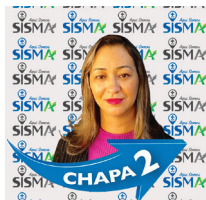
Kelly Tecnologia da Informação