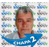
Rubens HR de Rondonópolis