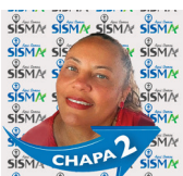
Odenete Ciaps Unidade 3