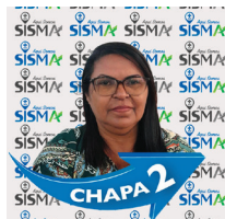
Ondina Hosp. Metropolitano