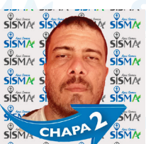
Rodrigo Tecnologia da Informação