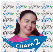
Ester Nível Central