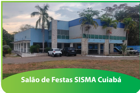
Salão de Festas SISMA Cuiabá

Obra de Conserto Estrutural em Cuiabá, devolvendo o Salão de Festas para o usufruto dos filiados e retornando a Administração SISMA para o prédio anexo.