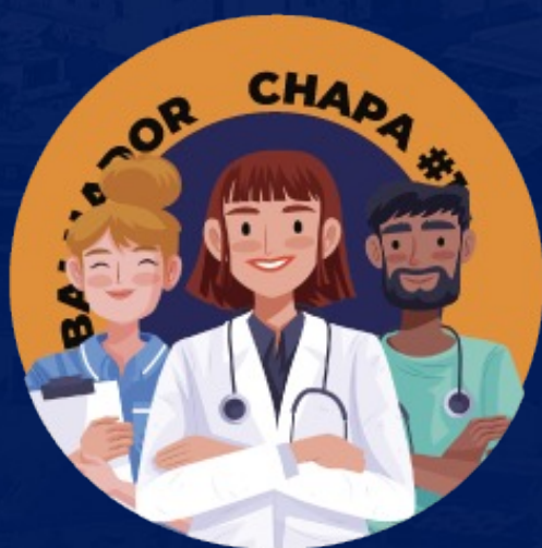
EM DEFESA DO TRABALHADOR (A) DA SAÚDE E DO SUS