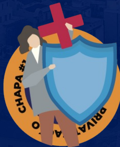
FRENTE CONTRA A PRIVATIZAÇÃO DA SAÚDE