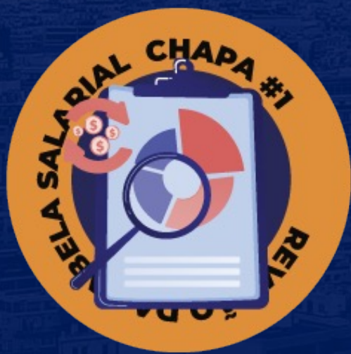
REVISÃO DA TABELA SALARIAL / 441/2011