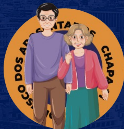
NÃO AO CONFISCO DOS APOSENTADOS E PENSIONISTAS