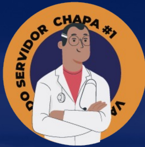
VALORIZAÇÃO DO SERVIDOR