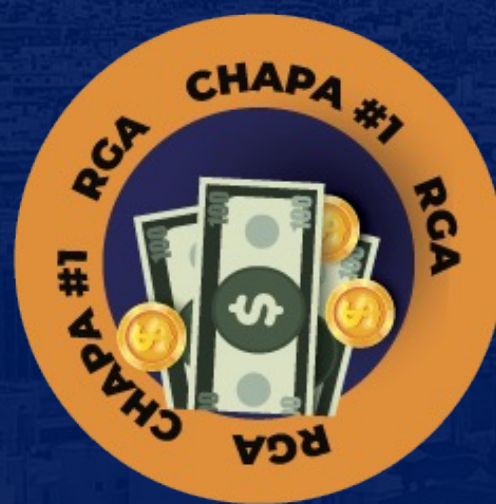
POLÍTICA DE REVISÃO GERAL ANUAL - RGA