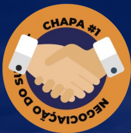
MESA PERMANENTE DE NEGOCIAÇÃO DO SUS - MT